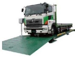
Weegbruggen voor vrachtwagens