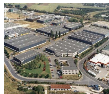
Kubota Europe S.A.S. (Frankrijk)

Aantal fabrieken in de wereld. 13 in Japan en 19 in het buitenland.