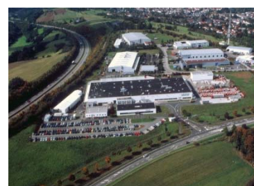
Kubota Baumaschinen GmbH (Fabriek in Zweibrücken - Duitsland)