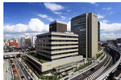
Hoofdzetel Kubota Japan (Osaka)

Opgericht in 1890 door Gonshiro Kubota, Kubota company startte met de productie van gietijzeren leidingen. Vandaag viert Kubota haar 127 jarig bestaan en de groei neemt elk jaar toe