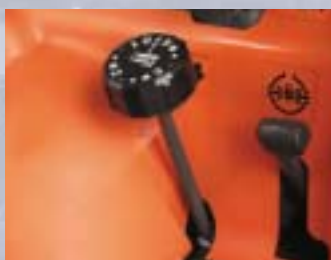
TONDEUSE – AJUSTEMENT DE LA HAUTEUR