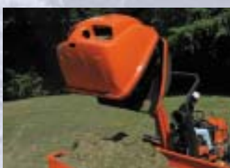
BAC DE RAMAS-SAGE HIGH DUMP