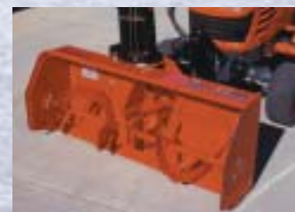
TURBINE À NEIGE