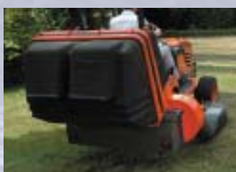
BAC DE RAMAS-SAGE LOW DUMP