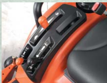
GUIDE LEVIER DE LUXE