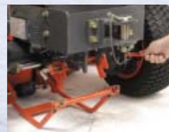
MÉCANISME ATTACHE/DÉTACHE RAPIDE