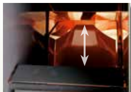
Funktion der Reinigungsklappe

Der Auswurfschacht kann einfach und schnell durch einen Hebel vom Sitz aus entleert werden. So wird ein Rückstau von Schnittgut im Auswurfkanal vermieden.