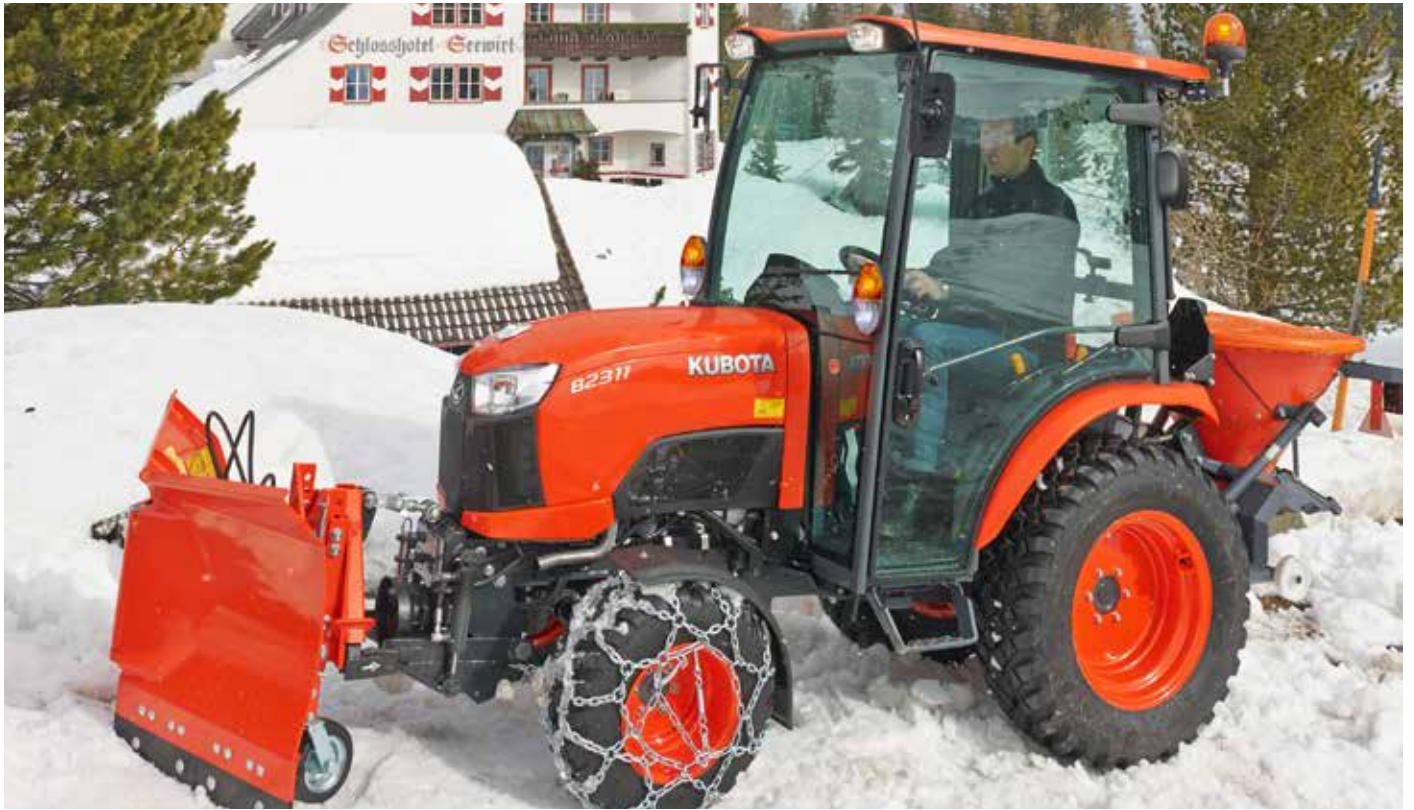
Schneeschild / Anbaustreuer