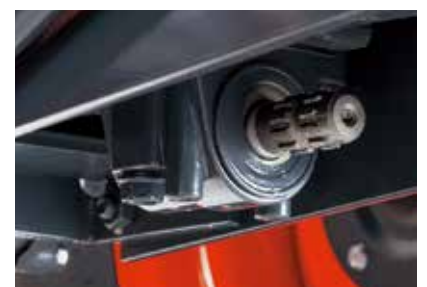
Wenden ohne Bi-Speed Lenkung