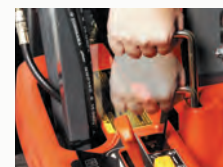
Per pulire la parte posteriore del tunnel

Azionando semplicemente una leva, una lamiera elimina l'erba che potrebbe essersi accumulata nel tunnel di scarico e libera così il passaggio verso il cesto. Questa operazione si effettua rapidamente senza che il conducente debba scendere dalla macchina.