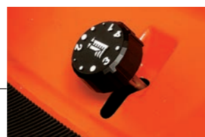
Gemakkelijk te bereiken maaihoogte-instelling