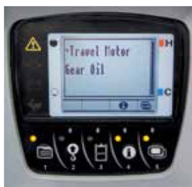
Service - Intervall - Anzeige