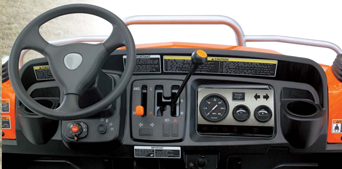
Tableau de bord clair à lecture rapide

Finalement, faites glisser le grillage de protection vers l'arrière, fixez le dossier de la banquette puis verrouillez-la en place. Maintenant profitez pleinement avec vos hôtes de cette nouvelle configuration de transport convivial. Pour bénéficier à nouveau de l'intégralité de la capacité de la benne du RTV1140 CPX, accomplissez les trois étapes en sens inverse.